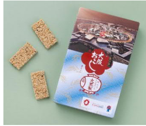
EXPO2025 ミヤクミヤクおこし缶 ＜あみだ池大黒＞