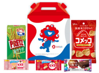
セレクション・ザ・グリコ 大阪・関西万博記念ボックス ＜江崎グリコ＞