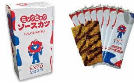
ミヤクミヤクソースカツ ＜やぶ屋＞