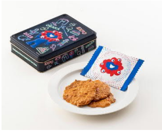
ドリカボ ＜神戸風月堂＞